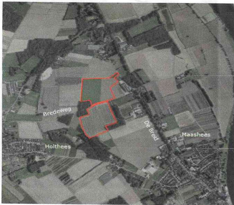
LOCATIE ZONNEPARK-INITIATIEF BREDEWEG (ROOD OMLIJND)

Op deze foto zijn lang niet alle huizen en percelen van omwonenden zichtbaar. Maar er zijn veel omwonenden (62 adressen binnen een straal van 500 meter, aldus TPSolar) die straks vanuit hun huis/(achter)tuin zicht op het zonnepark hebben. Met alle nadelige gevolgen van dien voor hun woongenot én de waarde van hun woningen.